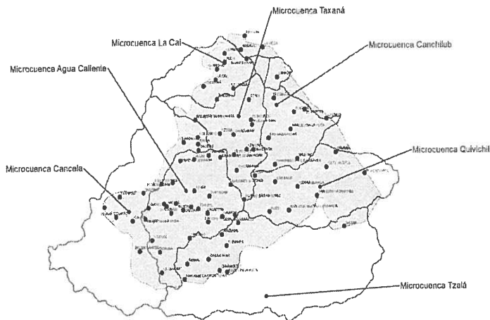
Figura 2: Mapa de microcuencas que interceptan el municipio de San Miguel Ixtahuacán

De acuerdo al análisis realizado de las microcuencas que interceptan los municipios se observó que varias de ellas tenían áreas entre 60 y 90 kilómetros cuadrados y algunas de estas cubrían casi el 80% del territorio. Este fue el caso de Comitancillo. Para ello se delimitaron microcuencas dentro de la misma microcuenca para definir con ese criterio áreas más pequeñas. Uno de los criterios de selección de microcuencas (formar corredores de microcuencas entre los municipios) no se cumple al 100%, por la disposición de las corrientes de los ríos y la posición de los municipios, área de las microcuencas, así como la ubicación de las comunidades que cumplen con los criterios de selección de comunidades. El caso de la microcuenca de Cancela que intercepta dos municipios (Concepción Tutuapa y San Miguel I.) no se seleccionó por no cumplir con la mayoría de criterios de selección de microcuencas y comunidades, aspectos que pesaron más que el criterio de conformar un corredor entre municipios.